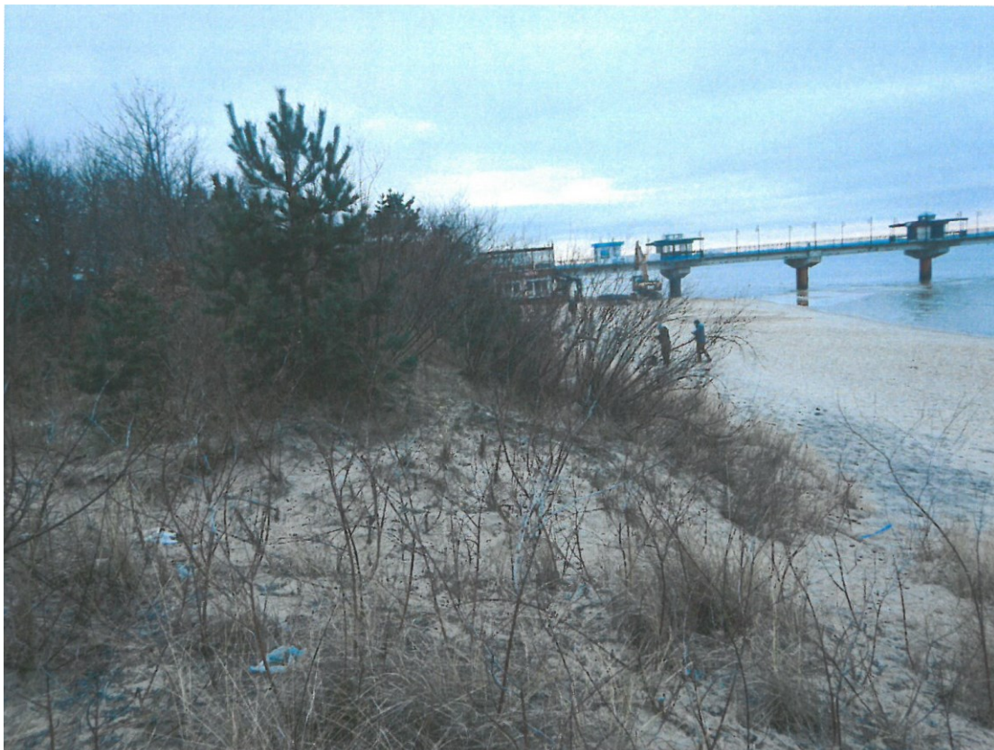
Ryc. 3. Biochora nr 2 – abradowany wał wydmy porośnięty sztucznie nasadzoną wierzbą kaspijską.