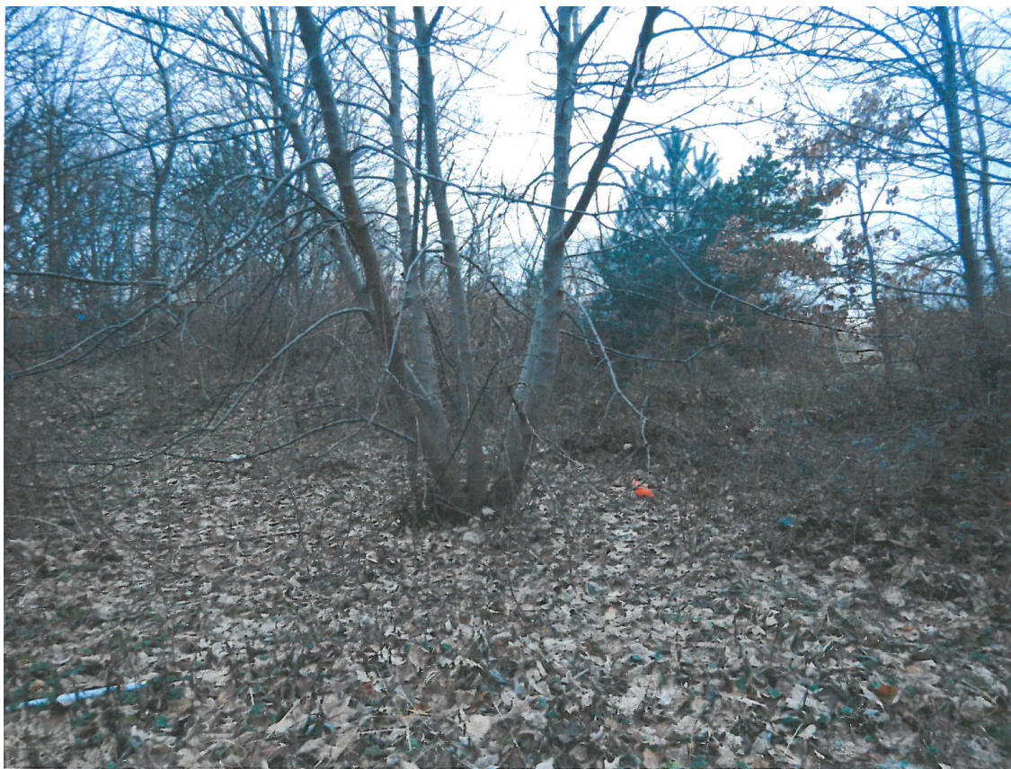
Ryc. 4. Biochora nr 2 – inicjalne zbiorowisko z klonem zwyczajnym.