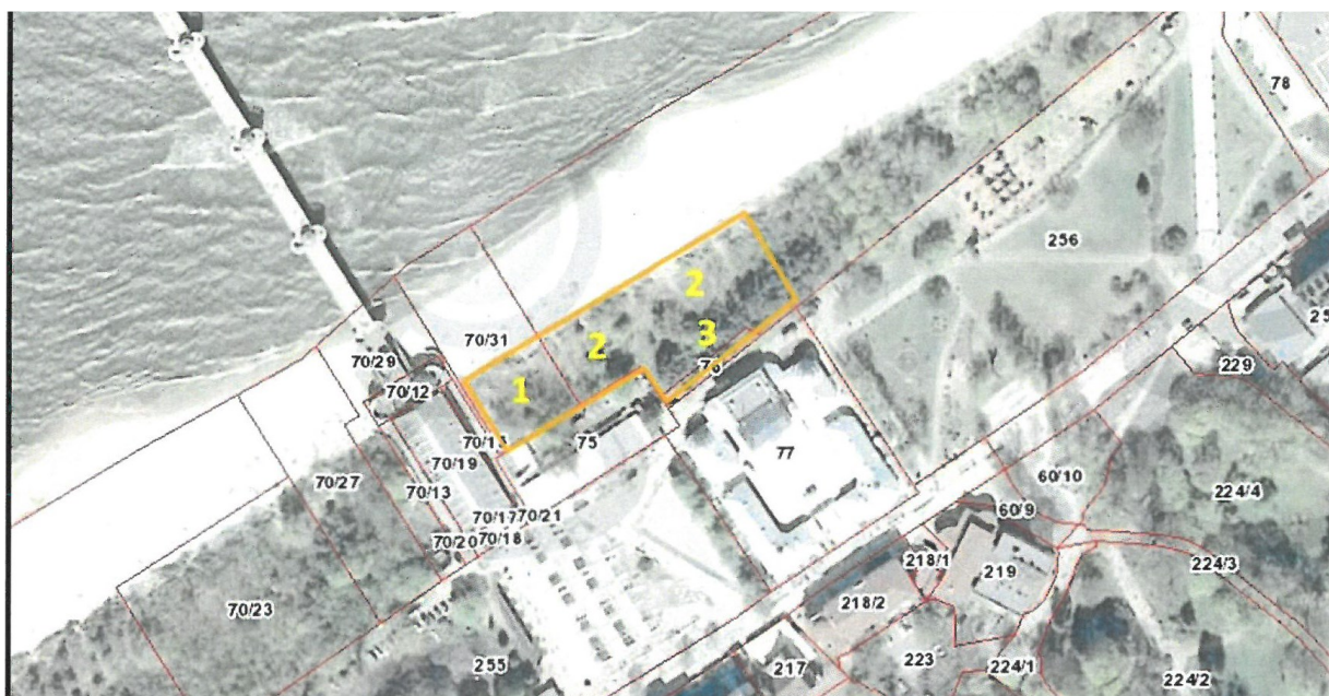
Ryc. 1. Zasięg lustrowanego obszaru w Międzyzdrojach wraz z zaznaczeniem biochor

W celu rzetelnej weryfikacji pełnego spisu gatunków chronionych w obrębie lustrowanego obszaru należy odbyć lustrację w dogodniejszym terminie.