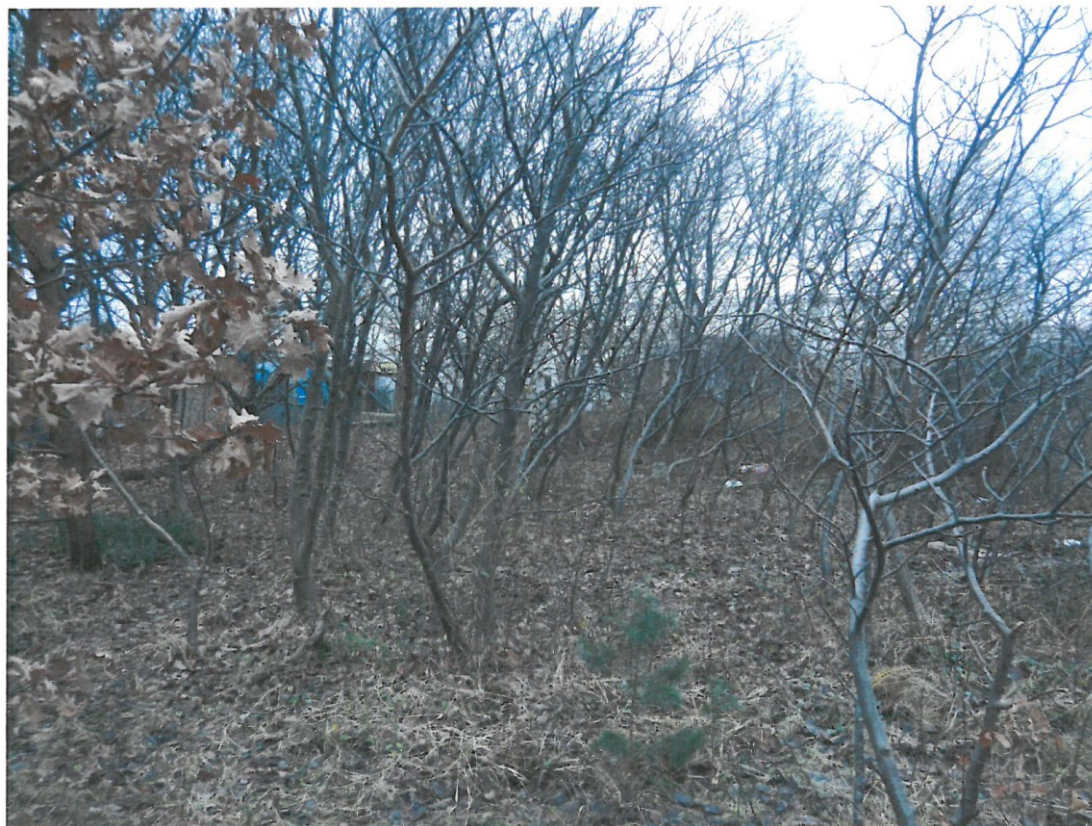
Ryc. 2. Biochora nr 1 – zbiorowisko niskopiennego lasu z jarzębem szwedzkim.