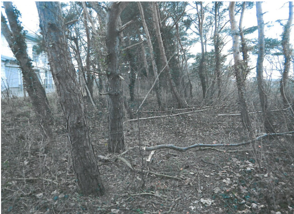
Ryc. 5. Biochora nr 3 – zbiorowisko zastępcze na wydmie z dominacją sosny zwyczajnej oraz podrostem klonu zwyczajnego.